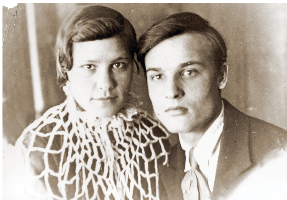
Папа и мама

«Что касается самого места смерти, поселка Карлсбизе, то он представляет