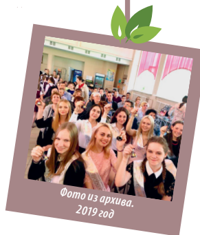
2019 год