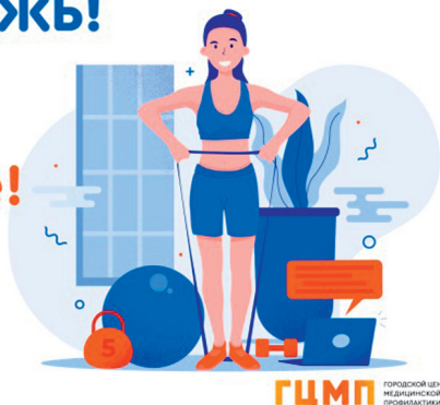
ГЦМП ГОРОДСКОЙ ЦЕНТР МЕДИЦИНСКОЙ ПРОФИЛАКТИКИ

На сегодняшний день нет каких-либо доказательств, свидетельствующих о том, что курение защищает от COVID-19.